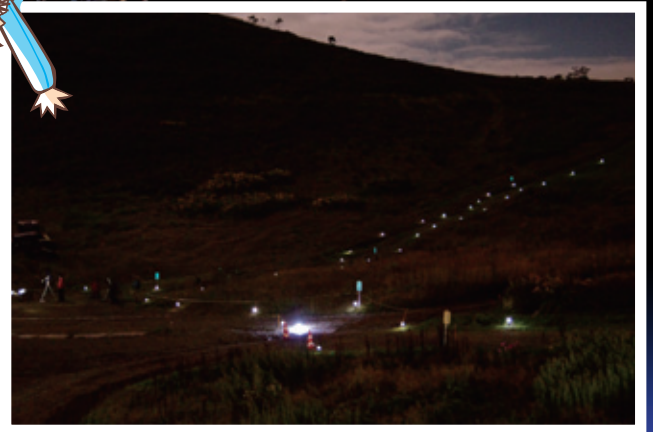
寝転んだりしながら星空観察ができる広場です。