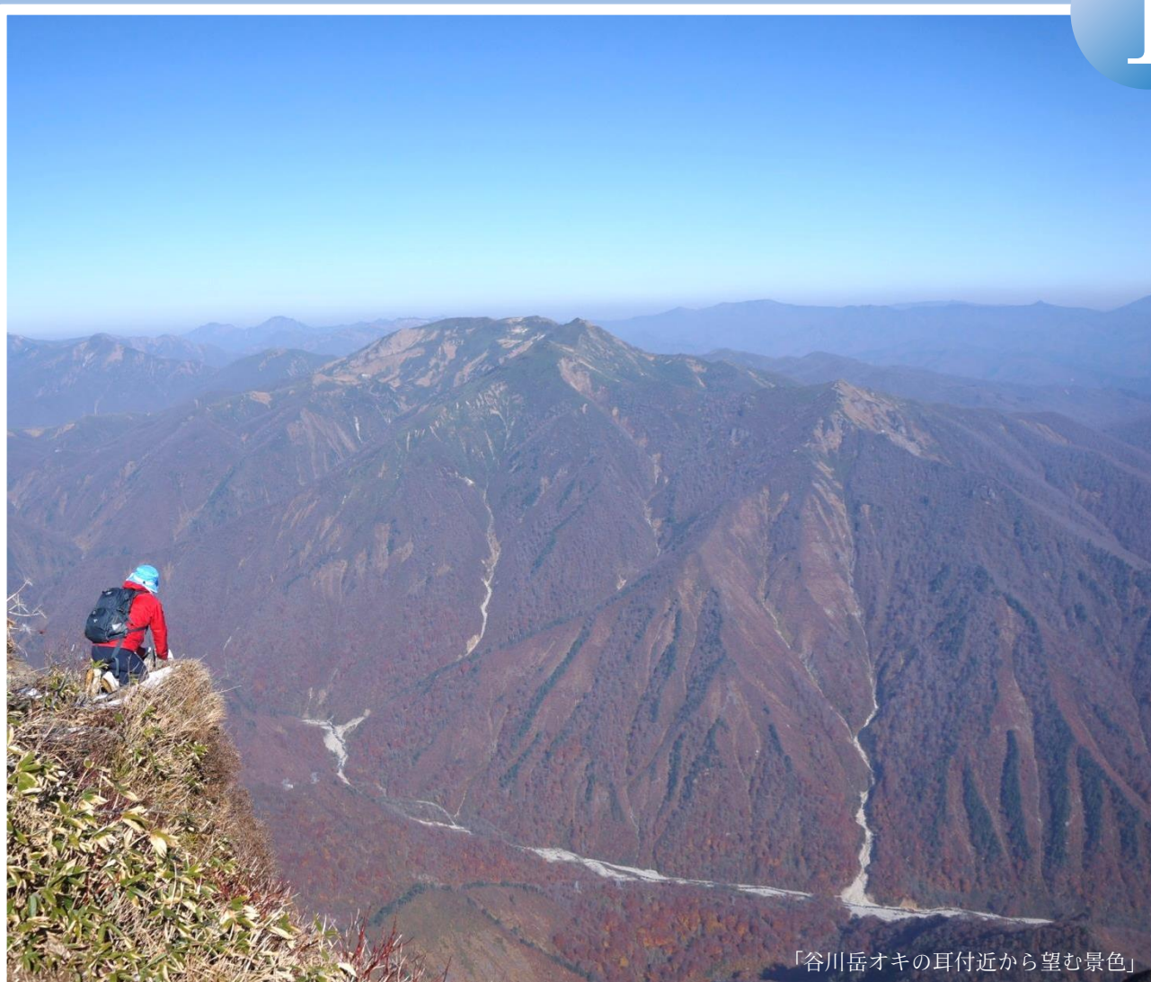
「谷川岳オキの耳付近から望む景色」