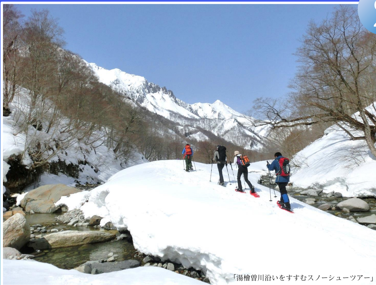
「湯檜曾川沿いをすすむスノーシューツアー」