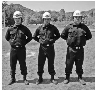
小型ポンプの部 優勝 第1分団