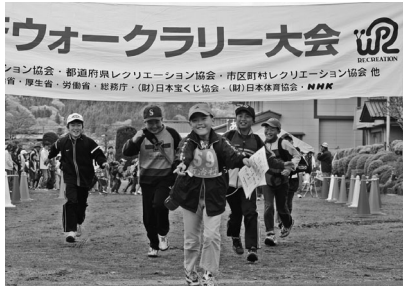
須川小学校をスタート！たくみの里へGO！