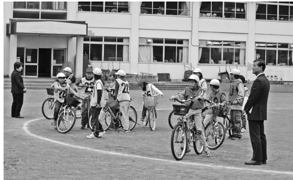
幸知小学校高学年 自転車走行訓練