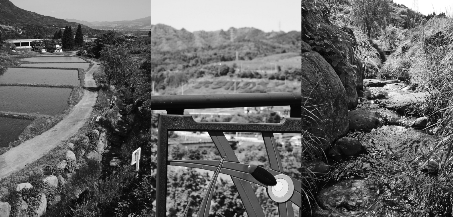
写真/①ホタル保護地の“のどかな風景”(古城沢) ②歩道の手すりにデザインされたホタル ③ホタルが生息しやすい石積み水路(古城沢)