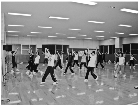
毎週月曜日、新治地域で行われているエアロビクス教室