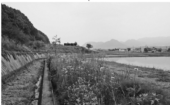
ホタル発祥地 下牧清水原整備された水路と水田地帯

こうして今では、毎年6月中旬から7月上旬にかけて初夏の夜を彩る、神秘的なホタルの光を大量に見ることができるようになりました。