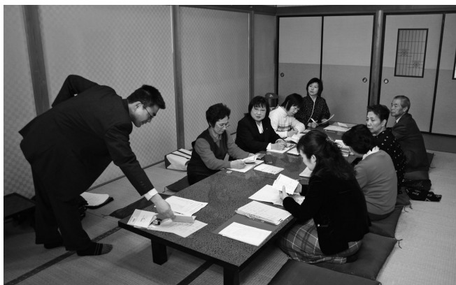
昨年新治地域で行われた講座は大変好評でした

■申し込み方法 各社ごとに人数をまとめ6月12日までに氏名と連絡先を明記のうえ、FAXまたは電話でお申し込みください。