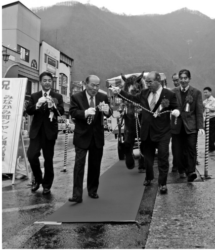
出発式では紅白の手綱と赤じゆうたんが用意されました