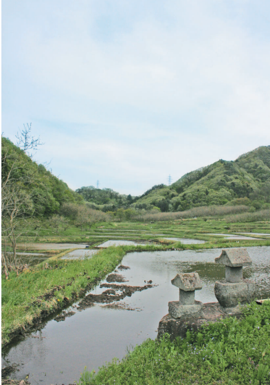
写真/④雪解け水で満水となった赤谷湖 ⑤田植え目前、水の張られた和名中地区の棚田を見守る石宮