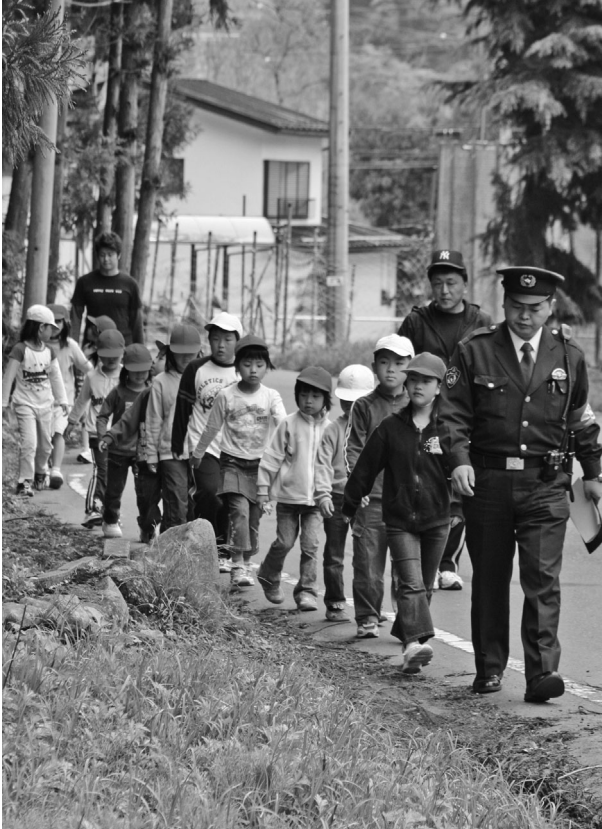
幸知小学校低学年 通学路歩行訓練

5月17日、幸知小学校で行われた交通安全教室では、実際に通学路に出て、警察官と交通指導員の指導で、正しい道路の歩きかたや横断歩道の渡り方、自転車の乗り方などを勉強しました。