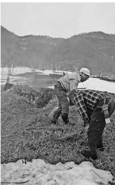
茅場に点火する藤原の高老

5月6日、藤原上ノ原の旧入会地で茅場(かやば)の野焼きが行われました。里山の保全・再生に取り組んでいる東京都の市民団体「森林塾青水」と地元の高老が協力し、40年ぶりに復活。今年の春で3回目を迎え、町の「春の風物」となっています。関係者やギャラリイが見守るなか、たいまつ種の火から点火され、約2ヘクタールを30分で焼き尽くしました。