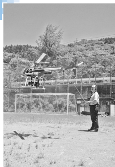
standby OK. take off!