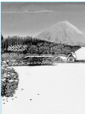
「冬の日の焼景」(部分) / 石田良介