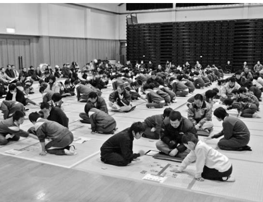
大会の様子(新治支部)