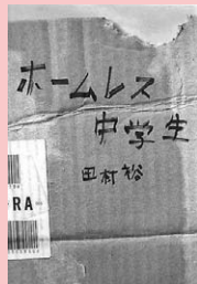
ホームレス中学生 田村裕／著 ワニブックス