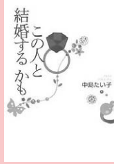
この人と結婚するかも 中島たい子／著 集英社