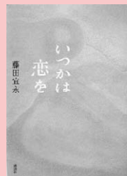
いつかは恋を 藤田宜永／著 講談社