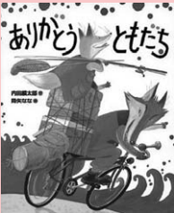
ありがともだち 内田麟太郎／作 降矢なな／絵 偕成社