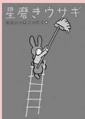
星磨きウサギ 那須田淳／作 吉田稔美／絵 理論社