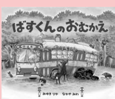
ばすくんのおむかえ みゆきりか／作 なかやみわ／絵 小学館