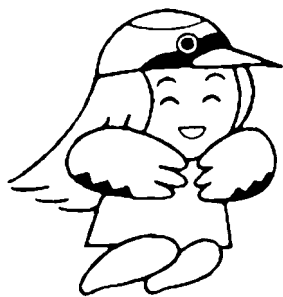
年金のイメージキャラクター「舞ちゃん」

■問い合わせ先 渋川社会保険事務所 ☎0279(22)1611 役場保健福祉課 福祉・窓口グループ ☎(25)5009