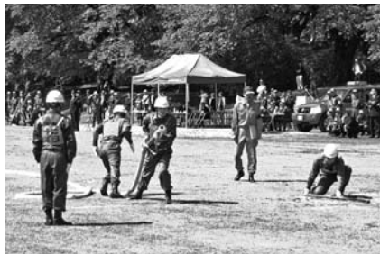
▲自動車ポンプの部 第5分団

6月1日、沼田公園において群馬県消防協会利根沼田支部消防ポンプ操法競技会が開催されました。この競技会は、利根沼田管内の市町村から自動車ポンプの部に9チーム、小型ポンプの部に10チームが出場し、正確な機器の操作と標的を倒すまでの時間、迅速かつ確実な行動・動作等について競うものです。 みなかみ町からは、自動車ポンプの部と小型ポンプの部にそれぞれ3チームが出場し、日頃から培ってきた技術を競い合いました。大会の結果は下記のとおりです。