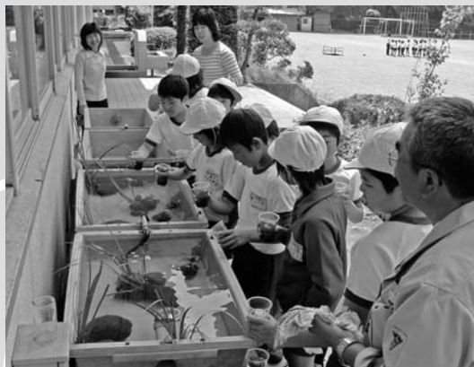
月夜野北小学校 カワナのお飼育