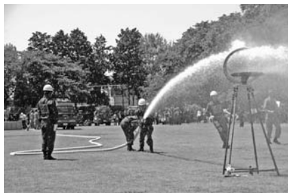
▲自動車ポンプの部 第3分団