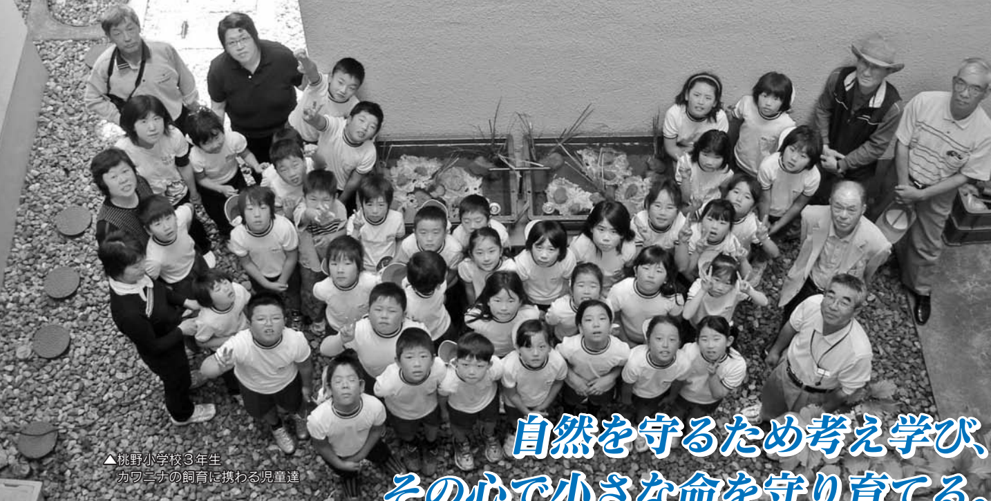
▲桃野小学校3年生 カワニナの飼育に携わる児童達