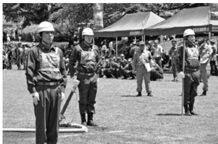
▲小型ポンプの部 第5分団