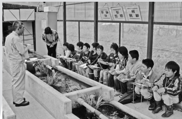
▶月夜野北小学校4年生 ホタル教室