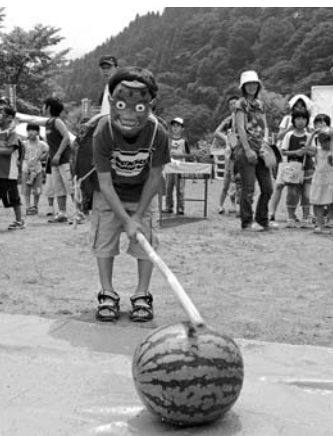
スイカ割り大会の様子

■内容 ▽11時～ カップ地藏安泰祈願祭、ネイチャークラフト製作体験、ストラックアウト、輪投げ ▽12時30分～ スイカ割り大会 ▽13時30分～ 魚つかみ大会