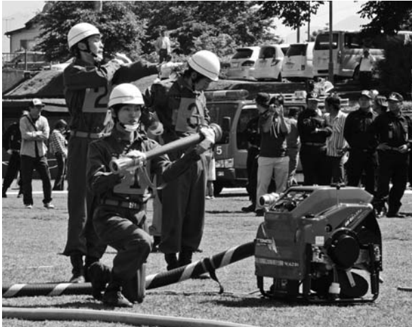
▶小型ポンプの部 第2分団