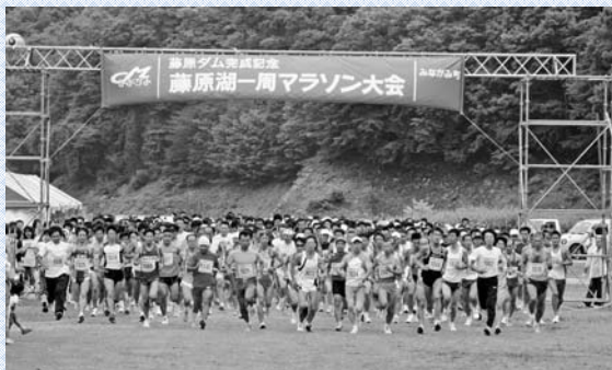
一斉にスタートする選手のみなさん