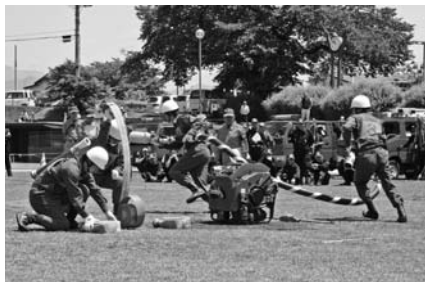
▲小型ポンプの部 第8分団