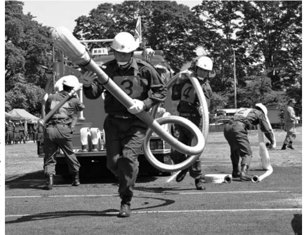
▶自動車ポンプの部 第7分団