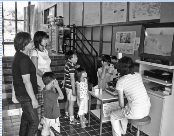
「夏休み親子教室」顕微鏡観察の様子