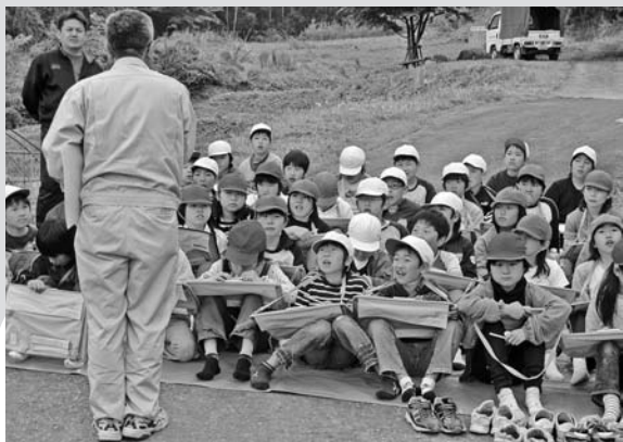
▶古馬牧小学校4年生 ホタル教室