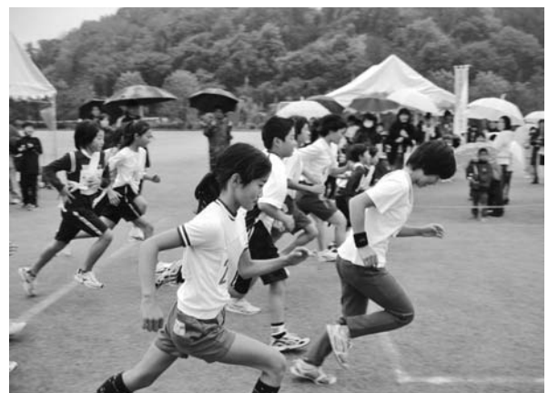
▲雨天の中、一斉にスタートした駅伝大会