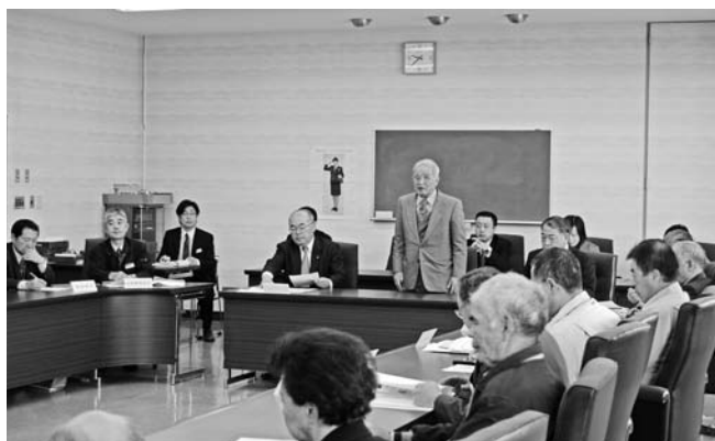
▲意見交換会で挨拶をする大森会長

意見交換会は、同連合会から日頃の疑問について発表して頂き、町の担当課から説明するという形式で実施しました。当日は同連合会から役員と関係者20人の参加があり、町からは各課の所属課長が出席して、参加者からの質問や意見について説明を行いました。参加者は身体障害があるため、日頃なかなか問い合わせできないような事柄について説明を受け、予定時間を超えるほど活発に意見交換が行われました。