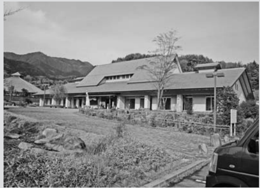
▲農村交流公園（遊神館）の外観