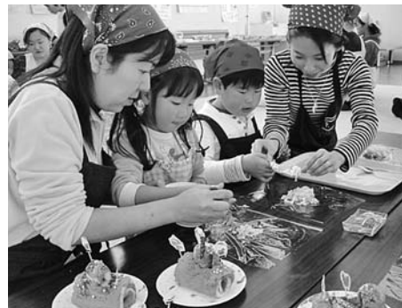
▲ラップ寿司作りの様子

12月7日、食生活改善推進員と町栄養士の指導のもと、「クリスマスパーティーメニュー」をテーマにクッキング教室が開催されました。 この教室は、親子で一緒に料理することで、手作りの楽しさを知り、食習慣や健康に関する関心を高めてもらうことを目的としています。 当日は、12組30人の親子が参加し、みんなで楽しくラップ寿司、鶏肉のカレー揚げ、たっぷり野菜とチーズのスープ、ミニブッシュドノエルなどを作りました。