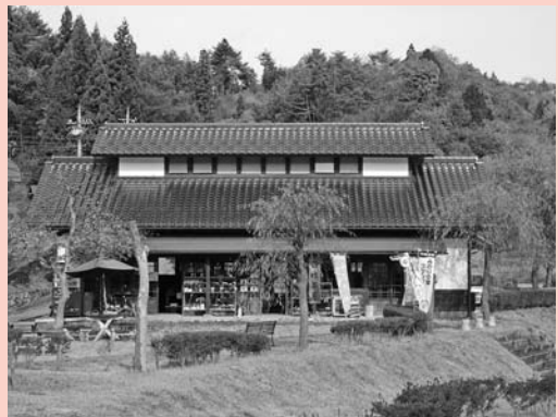
▲農産物直売所（百姓茶屋）の外観