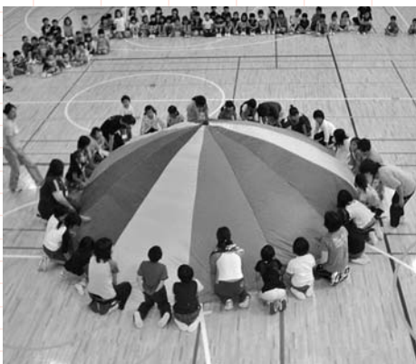
▲布製のパラシュートで遊ぶ子どもたち