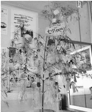
▲北っ子くらぶで作った七夕飾り!!