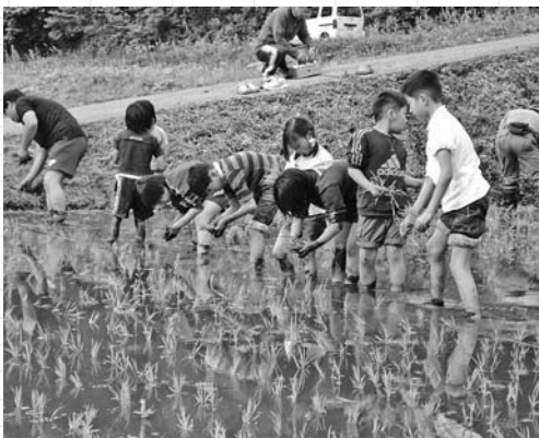
▲お米も作ります。(田植え体験)