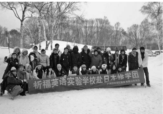
▲水上高原スキーリゾート

この時期、アジアでは旧正月の大型連休ということもあり、香港・台湾・中国・シンガポール等からの海外観光客が増加傾向にあります。国や群馬県が推進するYOKOSO JAPAN（ようこそじゃぱん）事業の成果で、近年アジアや欧米からの観光客が本町を訪れる機会も多くなってきました。たくみの里の体験やアウトドアが注目され始めていますので今後の誘客が期待されます。