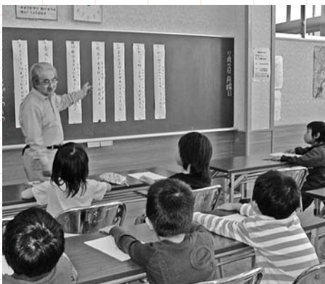
▲五、七、五。俳句を習っています。