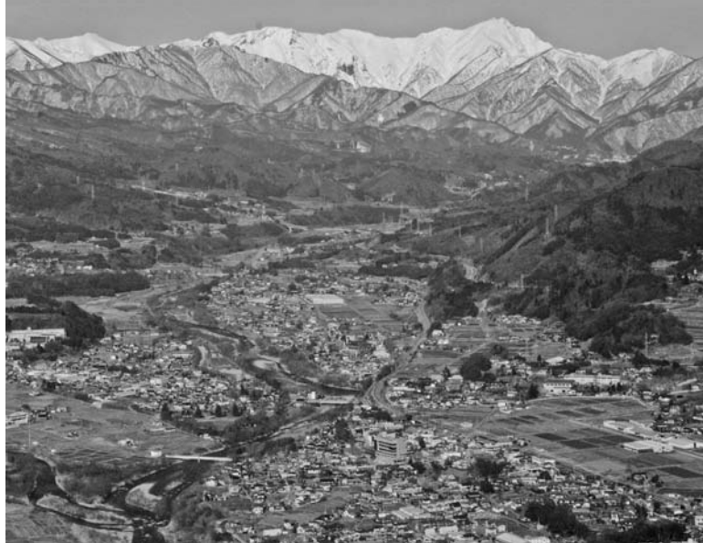
▶訓練の様子（患者をヘリに搬送） ▲ドクターヘリより町本庁舎、谷川連峰を望む

専用ヘリコプター」です。ドクターヘリは、現在全国で14道府県に16機配備されていて、今年度群馬県に配備される予定です。 基地病院は前橋赤十字病院で、ヘリは病院屋上ヘリポートに常駐し、県内どこでも20分以内で到着します。これにより、治療開始時間が早くなり、救命率向上と後遺症の軽減に絶大な効果が期待されます。