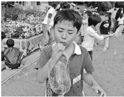
▲手でこんなに大きなシャボンが!! (シャボン玉遊び)

町内の6小学校では、放課後子ども教室を実施しています。 この教室は、放課後や週末に小学校の教室・体育館・校庭などを活用し、安全で安心できる子どもの居場所を設け、子どもたちに様々な活動の機会を提供するところです。また、子どもたちの健全育成に情熱を持つ地域の方々が「コーディネーター」や「安全管理員」として子どもたちを見守ってくれています。