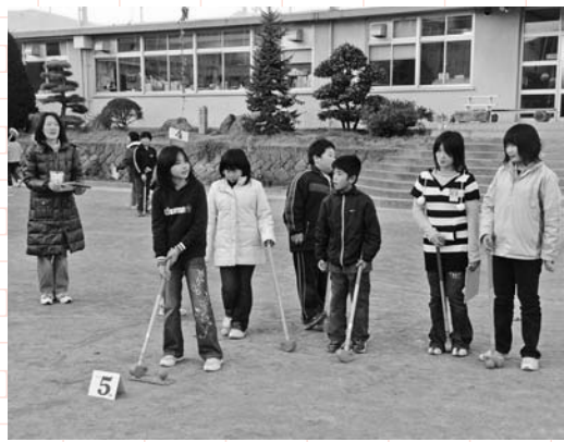
▲狙いを定めてGO!! グランドゴルフ