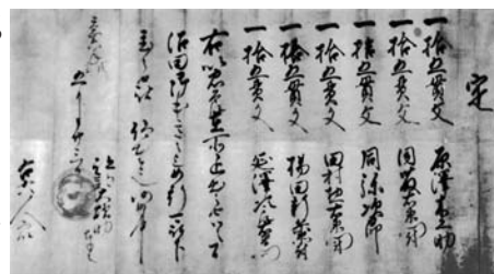
写真=みなかみ町布施 原沢悦治 家蔵 文書