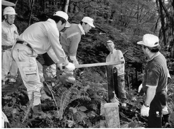
▲防護柵を設置するクラブの方たち