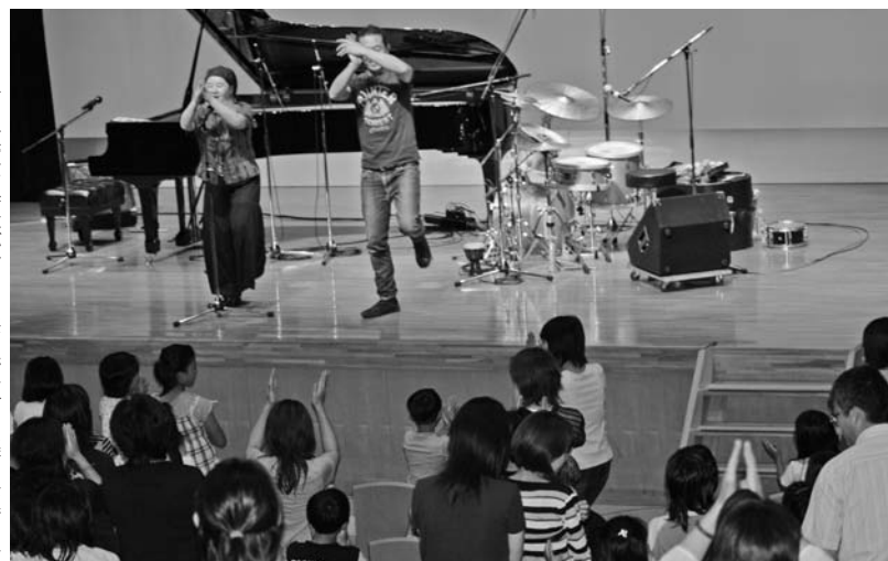
▶ 合同教室で春犬バンドと共にジャズを楽しむ参加者

当日は、東京でライブ活動や幼児の音楽教室を行っているジャズバンド「春犬（はるいぬ）バンド」を講師に招き、ジャズのリズムにあわせて会場全員で手や足を動かしたり、ステージに上がりピアノに触れるなどでジャズを体験しました。アンコールによる曲では、猫の鳴き声が演奏されるなど、参加した児童や保護者は「おもしろかった。」「大人も癒された感じがする。」などの感想があり、普段とは一味違った教室で楽しめました。 約一時間の講演の後、安全管理員の皆さんに「ドレミパイプの楽しみ方」を講習いただき、いくつもの音やリズムの組み合わせで、色々な楽しみ方があることを研修しました。