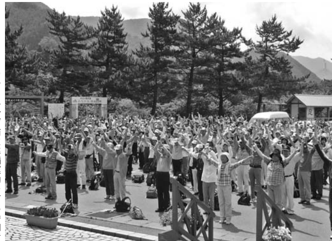
▶ ウォーキング前に準備運動をする参加者

これから本格的な夏山シーズンを迎えますが、体調を整え転落などには十分注意し、安全な登山を心がけてください。