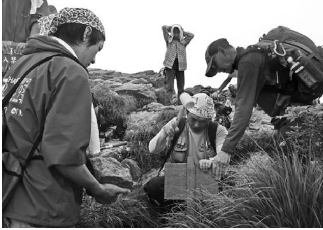
▶ 植生保護看板の設置風景

ベンチャー選手権大会」実行委員会のメンバー8名が、大会でお世話になった本町に御礼がしたいとのことから、谷川岳の高山植物を守る植生保護看板の設置や、登山道のゴミ拾い活動を行いました。