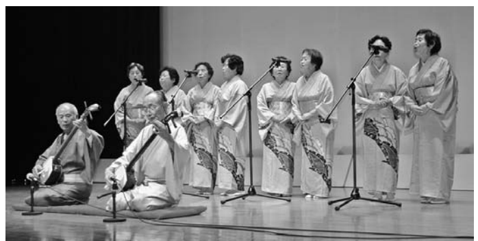
◀芸能発表会（カルチャーセンター）