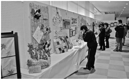
◀展示発表会（写真上）月夜野会場／写真中）新治会場／写真下）水上会場

また、芸能発表会では22団体がステージ発表を行い、日頃の練習の成果を披露してくれました。