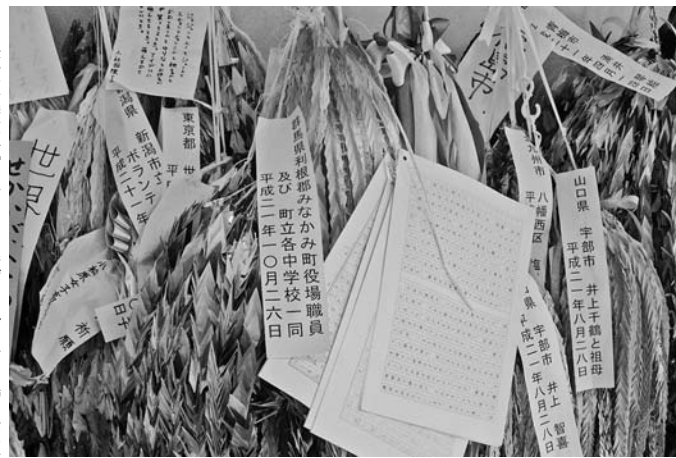
▶長崎原爆資料館入り口に掛けられた千羽鶴・作文

頂いた寄付金は、同事業の調査研究費用として「谷川岳エコーリズム推進協議会準備会」に支出させていただきます。ありがとうございます。また、 なお、（株）JR東日本ウォータービジネス社には、一ノ倉沢の案内板整備や一ノ倉沢登山道の架橋費用を全額支援して頂いています。