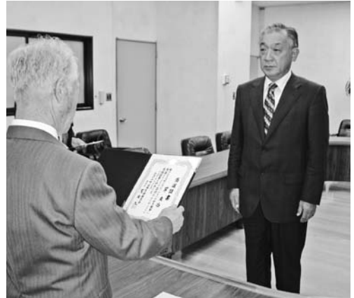
▲真庭委員長から『当選証書』が手渡されました