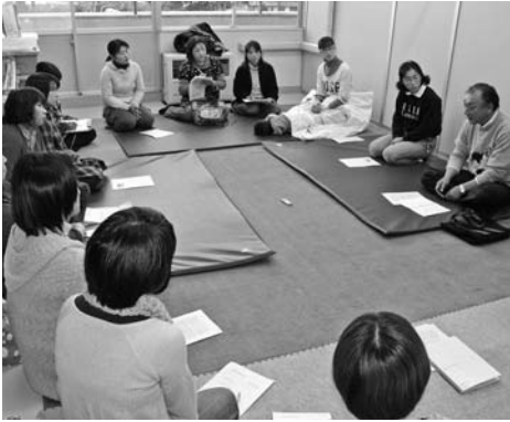
語る会の様子（子育て支援センター）

「少子高齢化」をテーマとして、座談会形式で行いますので、この機会に是非、町長と語り合ってみませんか。