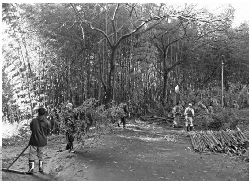
▶新巻地区のこさ切りの様子

事業実施により、安心安全なまちづくりの実践と、多くの住民が連携し地域の課題解決を図ることができました。