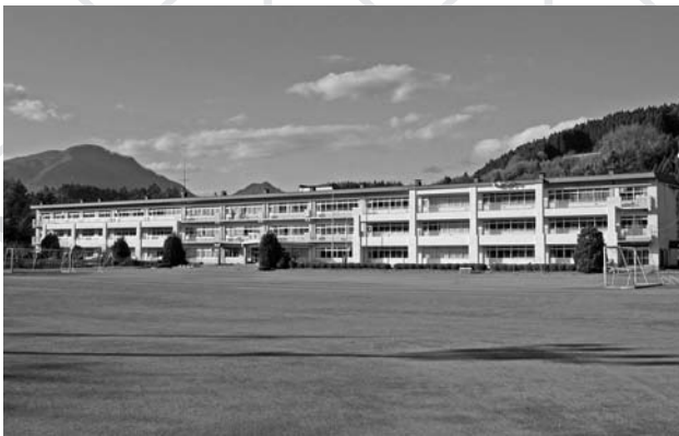
▲耐震補強工事が完了した新治中学校校舎