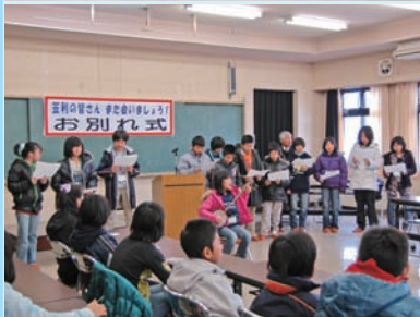
写真④：赤沢スキー場にて（初雪体験） 写真⑤：お別れ式（しまうたの贈り物）