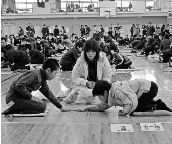
▲町上毛かるた大会の様子（個人戦）