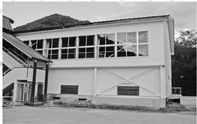
▲耐震補強工事が完了した藤原小学校体育館