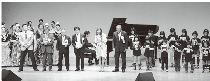
会場全体で大合唱