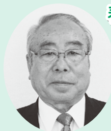
きよくじつ そうこうしやう 旭日双光章