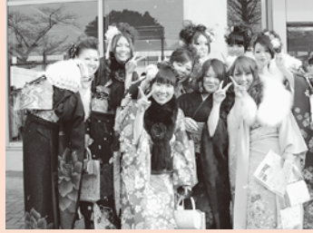
写真：第5回成人式より