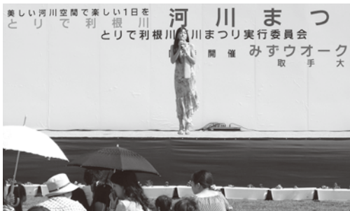
▲取手河川まつりで町のうたを披露