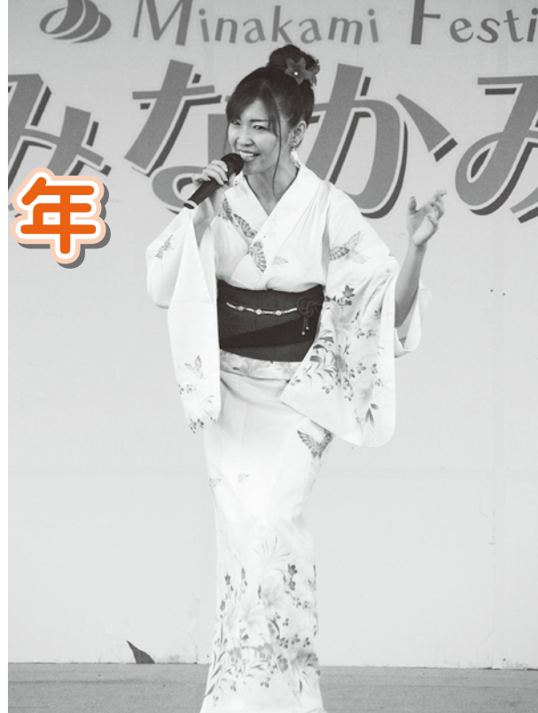
▲みなかみ祭りでのうたを熱唱

町のうたにより、多くの町民の方に愛郷心を高めていただき、また町外にもPRして、みなかみ町の名前が全国に広まることが期待されます。