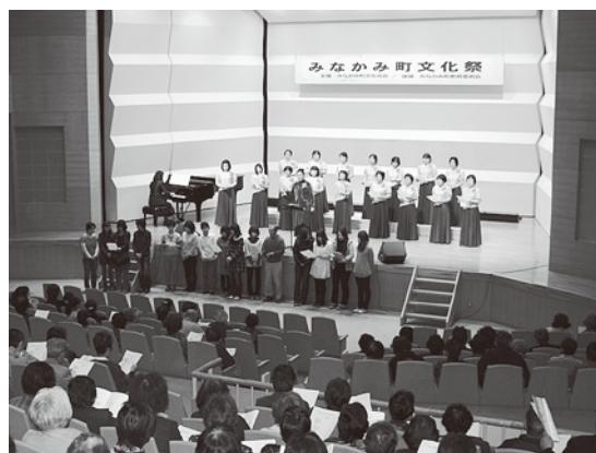
▲芸能発表会（カルチャーセンター）