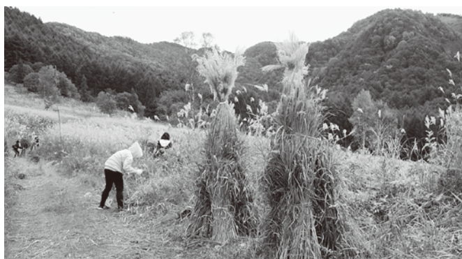
▲茅刈り検定の様子

二日目は茅刈り検定が行われ、参加者は「上級茅刈士」を目指し真剣に取り組んでいました。