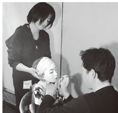
▲本格的な歌舞伎の化粧・着付けを体験する小学生

10月31日、町観光会館において歌舞伎のワークショップ「楽しい歌舞伎教室」が開催されました。