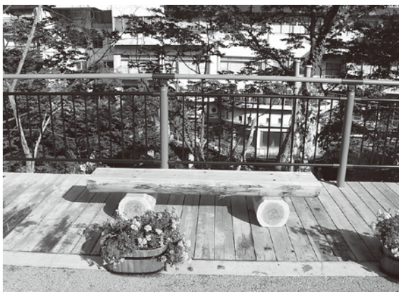
▶設置された木製ベンチ