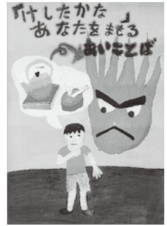
▲原 勇貴 (幸知小2年)