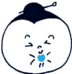
♪むすんでひらいて♪

楽しくおいしく食べるための準備体操です。 この体操をすることで、唾がよく出るようになり、舌がなめらかに動いて物が飲み込みやすくなります。 健康教室や介護予防教室でも行われています。 「むすんでひらいて」の歌に合わせて健口体操をしてみましょう。