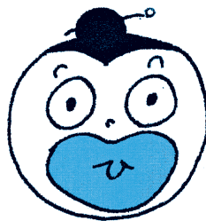
♪またひらいてべく出して♪