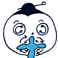
べくをグルグル回します