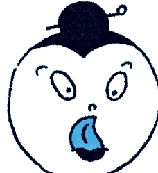
♪そのべく鼻にべくを右にべくを左に