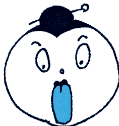
♪べく出してむすんで♪