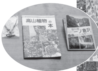
▶利根商業高生徒により作成された散策マップとノベリテイ記念品