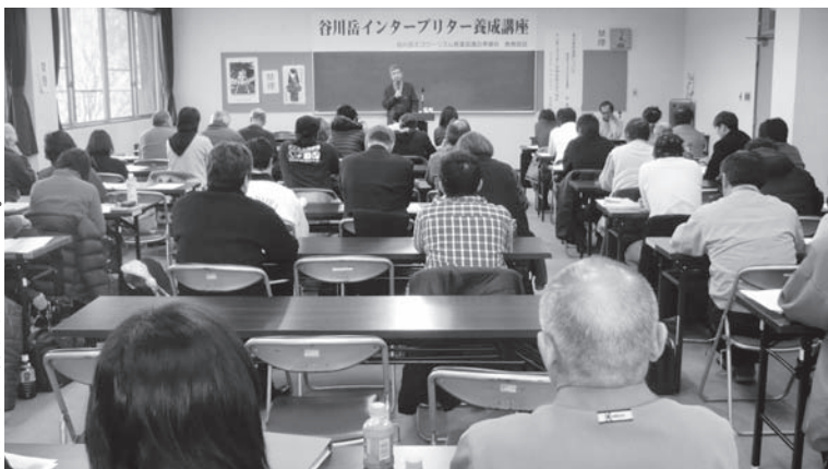
▶インタープリター養成講座の様子

平成23年5月に、モニタリング委員会を立ち上げ、専門家によるエコツアーリズム推進区域の自然基礎調査や、インタープリターが解説するための素材提供をお願いしました。