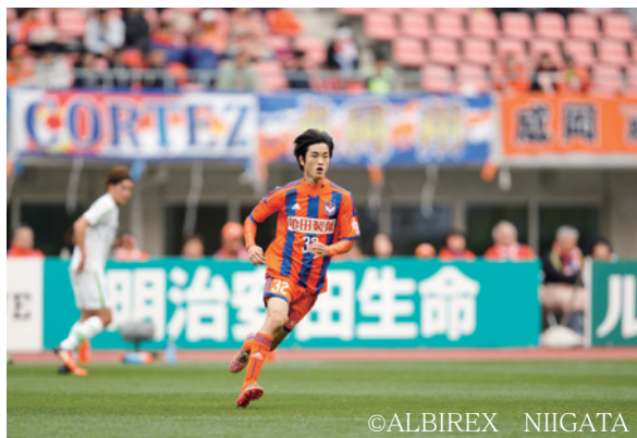
▲J1リーグ第16節出場の宮崎さん

トップチームと契約したことでプロサッカー選手となったので、ここをスタートラインと捉え、将来はJリーグで活躍し、いずれは海外でもプレーしたいと決意を語ってくれました。