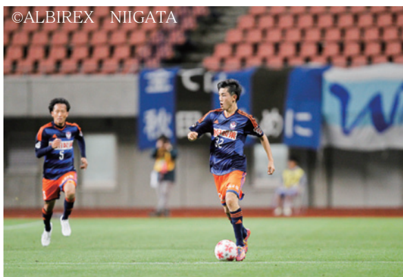
▲天皇杯2回戦に出場