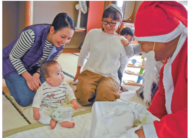
右／子育てサークル わくわく 左／子育てサークル キラキラ 左下／子育て支援センター 汽車ぽっぽ

12月中旬、子育て支援センター汽車ぽっぽ、子育てサークルキラキラ、わくわくにおいてクリスマス会が開催されました。ハンドベル演奏や読み聞かせなど様々なイベントが3か所で行われ、にぎやかな声につられて、すべての会場にサンタさんが来てくれました。サンタさんの登場に驚いて泣く子もいましたが、慣れてくると最後に笑顔で記念撮影をしていました。