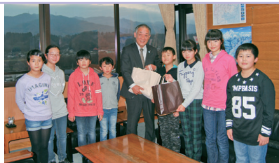
▲募金を手渡す桃野小児童会