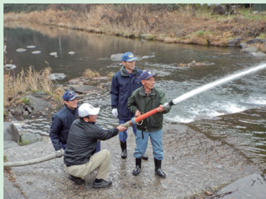
▲放水訓練を行う湯宿区住民

各行政区や自主防災組織において、初期消火訓練や避難訓練等の有事に備えた活動として実施をご検討ください。