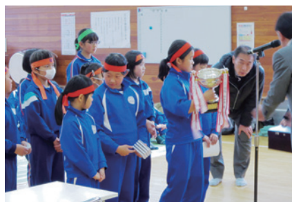
▲小学校低学年の部 優勝 新巻子ども会の皆さん