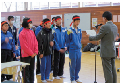
▲中学生の部 優勝 布施子ども会の皆さん