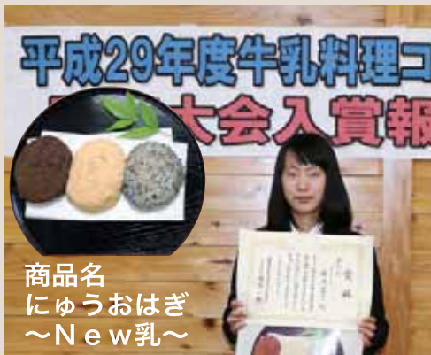
▲利根実業高で行われた報告会