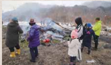
▲燃え方が落ち着くと、参加者は餅やすめを焼いて食べながら、1年の健康を祈願しました。