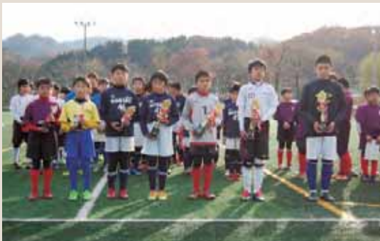
▲熱戦を勝ち上がったチームがトロフィーを手にしました。