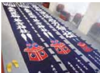
▲奉納幟(ほうのうのぼり)