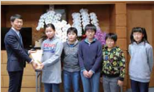
▶古馬牧小学校代表児童の皆さん