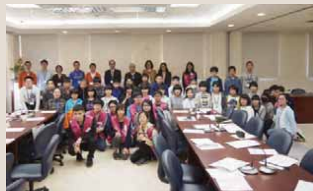
▲大学生とは1日一緒に行動しました。【長榮大学】

午前中の最後にはクリスマスプレゼントの一環として、中学校の中庭において「サンタが町にやってくる」と「故郷」の2曲を歌い、また「ラジオ体操第一」と「みな coming 体操」を披露しました。全校生徒約1800人を前にして、緊張しながらも楽しく発表できたことは、有意義な経験となりました。