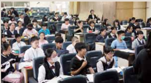
▲書道の授業【崇明中学校】