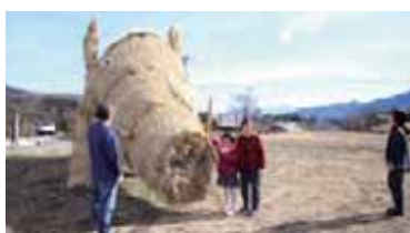
▲写真を撮る観光客も多い

まれてきた。みなかみ町で半年余り地域の様子や人・風土・食などを観察して田舎で似ていると思いついたイベント企画だった。木と竹で骨組みをつくり稲ワラで成形してイノシシをつくった。今治と同じにはならなかったが、思ってもないところに「ヒーロー」を見つかることができた。作業に地元の人何人も参加してくれた。もっともって地元の人参加でき、経済活動に繋がるイベントを企画運営していきたいと思っています。