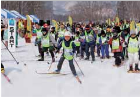
参加者に年齢の上限はありませんので、家族、友人同士お誘いの上参加ください。