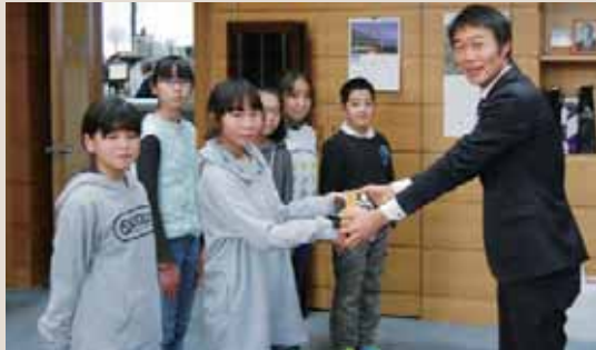
▲桃野小学校代表児童の皆さん