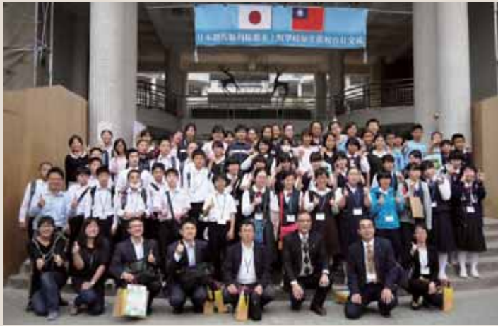
▲熱烈的な歓迎を受けて親睦を深めました【崇明中学校】

参加した中学生は、出発前の11月から始まった全4回の学習会に出席し、台湾や台南市の歴史、文化、生