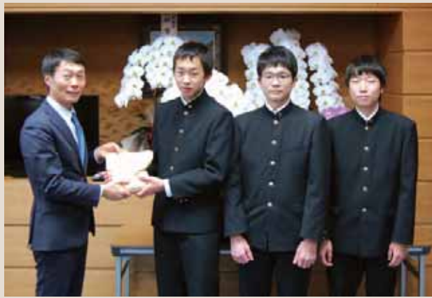
▲月夜野中学校代表生徒の皆さん