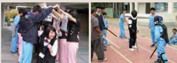
▲お別れの時の様子