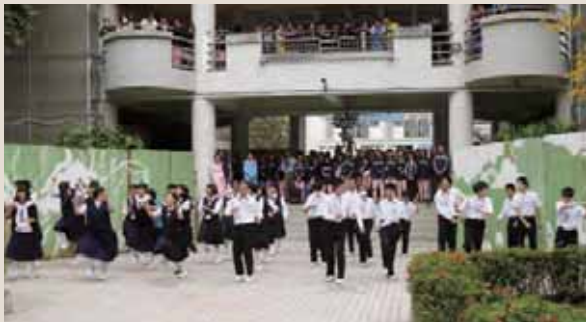
▲みな coming 体操を披露【崇明中学校】