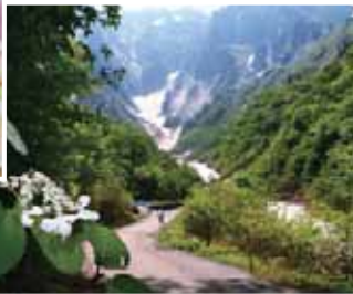
まちづくりの推進 エコパークの取り組み