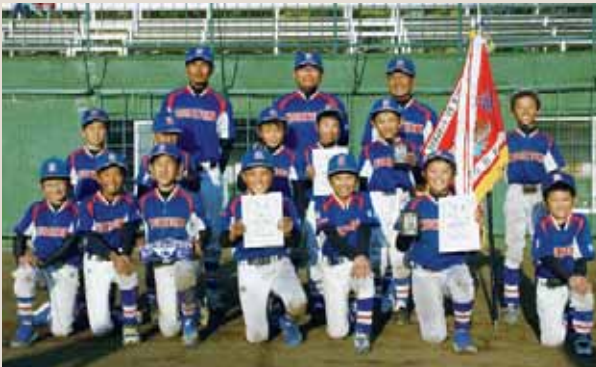
▲準優勝を決めて笑顔いっぱい選手

11月3日、第44回群馬県選抜少年学童軟式野球利根沼田支部選大会が開催され月夜野イーグルスが準優勝しました。平成31年3月に上毛新聞敷島球場等で開催される県選抜少年学童軟式野球大会に利根沼田支部代表として出場します。準決勝では、利根少年野球に17、15の2点差で迎えた最終回に3点をとり、逆転サヨナラにより劇的な勝利を納めました。決勝戦で対戦した昭和イーグルスと一緒に、利根沼田支部の代表となりました。 月夜野イーグルスの団員14名（1年生～5年生）でベスト8進出を目指します。