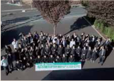
▲高所からドローン撮影