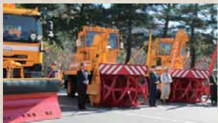
▲除雪作業中の事故が起きないように安全祈願しました。

11月15日、国土交通省高崎河川国道事務所および県内の除雪作業請負業者が集まり除雪出陣式が行われました。安全で素早い除雪作業を進めるため、皆さんの協力をお願いします。