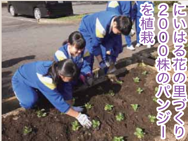
▲中学生は配置を考えながらしっかりと植えていきます

10月19日、新治B&G海洋センターにおいて、にいはる花の里づくり委員会が呼びかけ、花壇の植え換え作業を行いました。