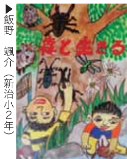
▶飯野 颯介 (新治小2年)