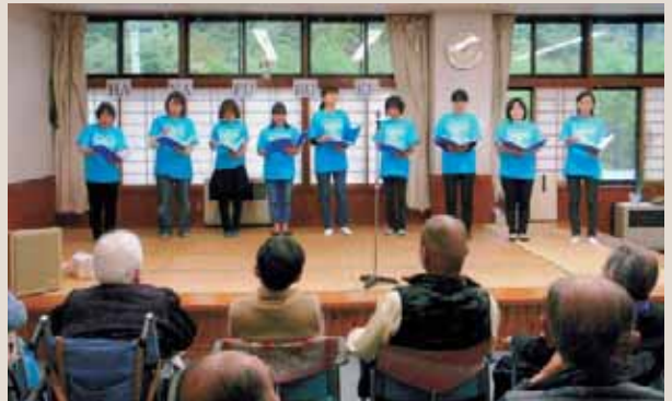
▲歌や踊りを楽しむデイサービス利用者

9月27日、みなかみ町母親クラブを母体とするコーラスグループ「HANAFUBUKI水上」が高齢者婦人センター（こぶしの里）を訪問して水上デイサービスの利用者と一緒にひとときを過ごしました。 今年で3回目の訪問となったHANAFUBUKI水上は、美しいコーラスを聴かせたほか、入所者と一緒に懐メロや童謡を歌ったり、手遊びしたりとレクリエーションしました。 コーラスグループの方は「皆さんには大変喜んでもらいよかったです。来年も来ます」と約束したそうです。