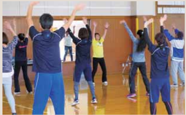
▲全身運動で心身共にリフレッシュしました

10月28日、B & G 海洋センターで新治地区スポーツ推進委員が主催するスローエアロビック体験会を行い、20名が参加しました。