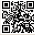
動画はこちらから

利根沼田地区の高校5校がドローンで撮影した地域紹介の動画を発表する「私たちの愛するまちのためのドローンプロジェクト」が行われ最優秀賞には尾瀬高校の旧校舎での地域のつながりを表現した作品が選ばれました。地元の魅力を再認識すると同時に、活用の可能性を広げているドローンに高校生のうちから慣れ親しんでもらおうと沼田ロータリークラブ主催、利根沼田テクノアカデミーが協力して開催されました。 利根商業高等学校はみなかみ町の水にスポットを当てて、ドローン目線で撮影した、一ノ倉沢や諏訪峡、奈良俣ダムなどを作品にしています。