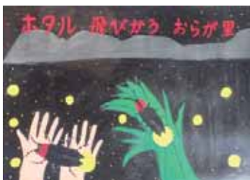
▲北野 佑輔 (新治小6年)