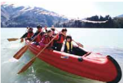
生活環境の課題解決