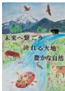
▶山田 萌絵 (水上中3年)