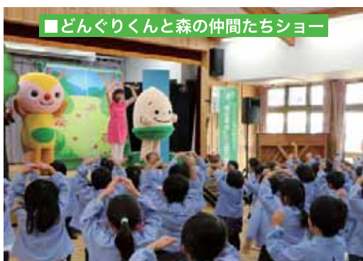
■どんぐりくんと森の仲間たちショー

▲森のお姉さんが大きな絵本を使って森の役割を説明。どんぐりくんとエコロンが登場して元気よく森の体操。