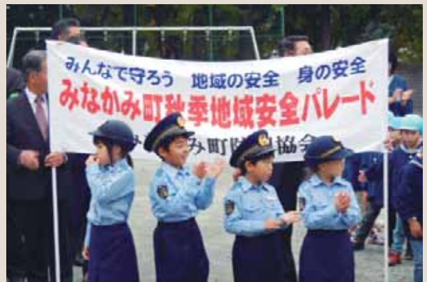
▲ちびっ子警察官に歓声が上がりました

10月23日、みなかみ町防犯協会主催のみなかみ町秋季地域安全パレードが開催されました。