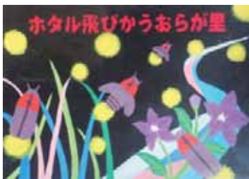
▲渡部 凜 (新治中2年)