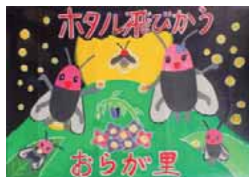
▲高橋 佑衣 (桃野小6年)