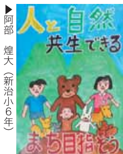
▶阿部 煌大 (新治小6年)