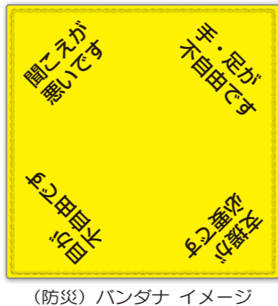
(防災) バンダナ イメージ