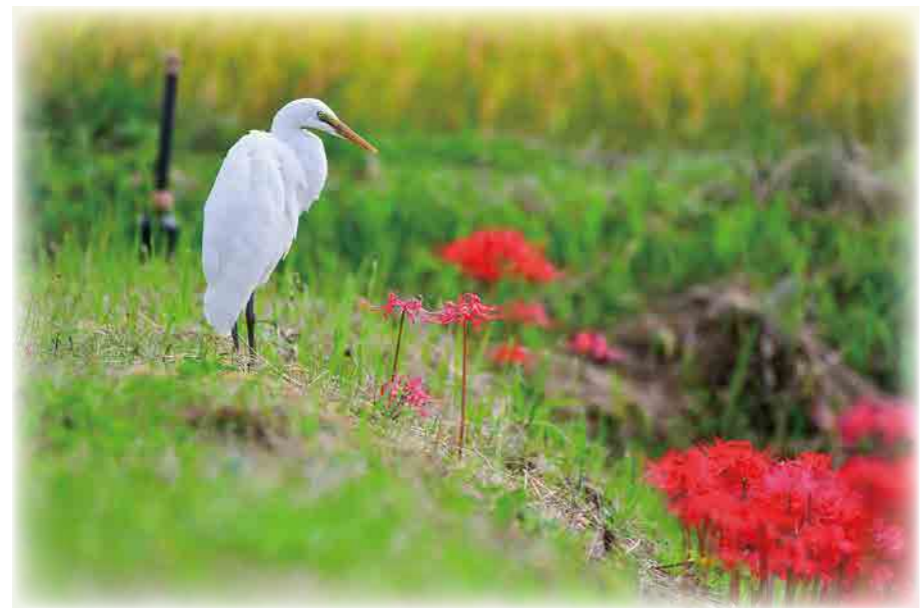
ダイサギ (撮影場所：羽場)