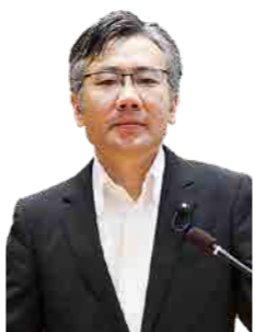
星野 宗央 議員