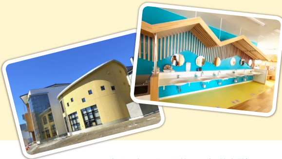
令和8年4月、開校!! (3校合併) 「月夜野小学校(つきよのしょうがっこう)」