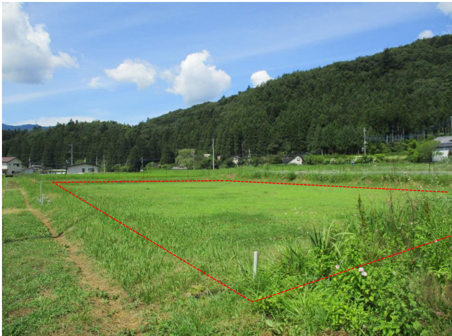
写真② 南西方向から撮影