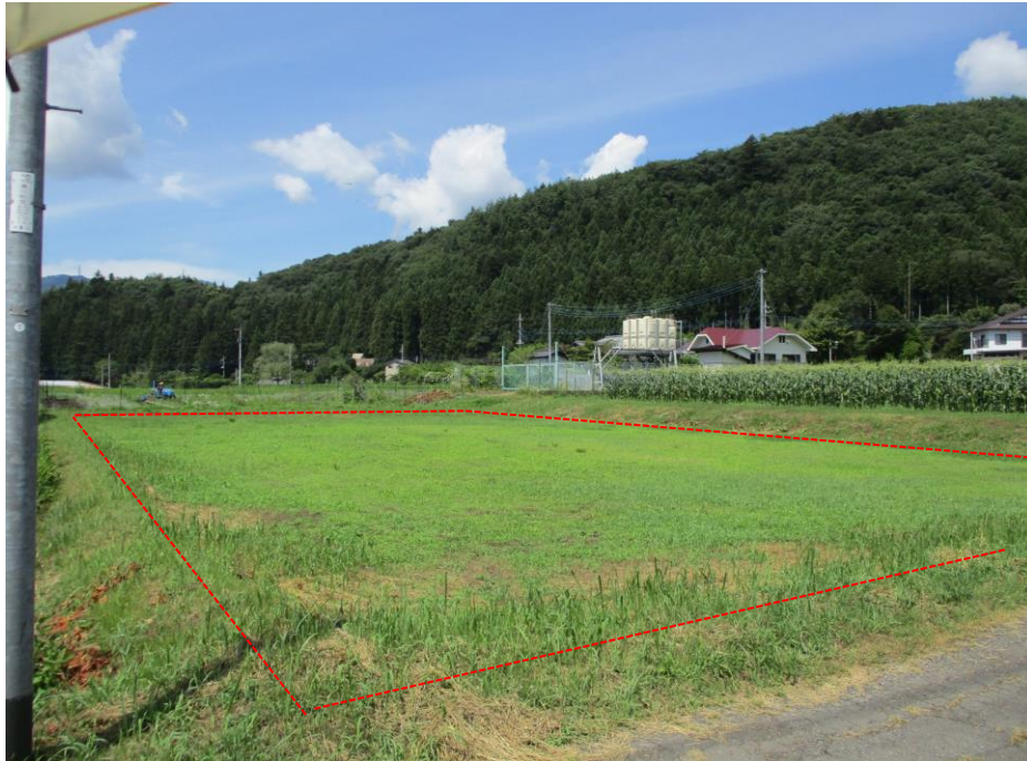
写真② 北西方向から撮影