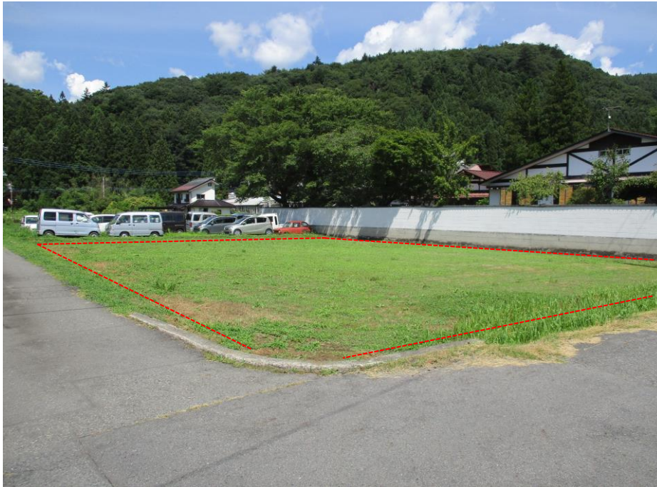
写真② 南西方向から撮影