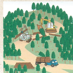
適切に森林整備を推進!

ことから、森林の土地の所有者の把握を進めるため、平成24年4月から森林法に基づく森林の土地の所有者となった旨の届出制度が創設されました。なお、この届出により、森林の土地の所有権の帰属が確定されるものではありません。