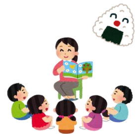
手遊び・よみきかせ など