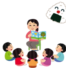
手遊び・よみきかせ など