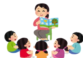
手遊び・よみきかせ など