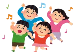
親子遊び・バランス体操

内容：親子遊び・集団遊びなど。遊びながら楽しく学ぶ教室です。 *水筒を持ってきてください。