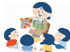
手遊び・よみきかせ