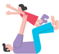
親子遊び・バランス体操