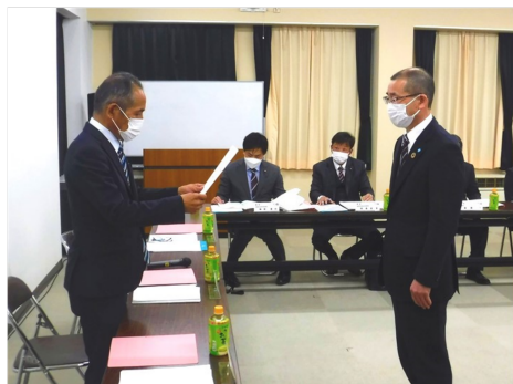
委嘱状交付(町長から教育長へ)

第1回の準備委員会は、令和5年4月26日(水)午後7時より、みなかみ町中央公民館大会議室で開催されました。