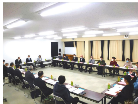
統合準備委員会の様子

令和8年4月に古馬牧小学校、桃野小学校、月夜野北小学校の3校が統合し、新しい小学校が開校します。開校に向けて円滑に準備が進むよう「(仮称)月夜野統合小学校準備委員会」が発足しました。開校するまでの間、準備委員会で協議、調整された内容について『統合準備委員会だより』を発行し、保護者の皆さんや地域の皆さんにお知らせします。