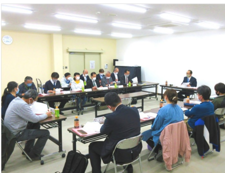
総務・地域関連部会の様子