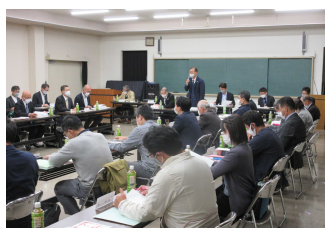
第2回統合準備委員会の様子