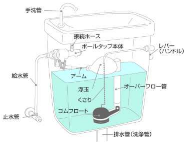
トイレ・ロータンク構造図