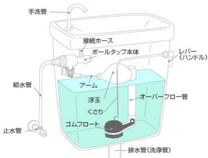
トイレ・ロータンク構造図