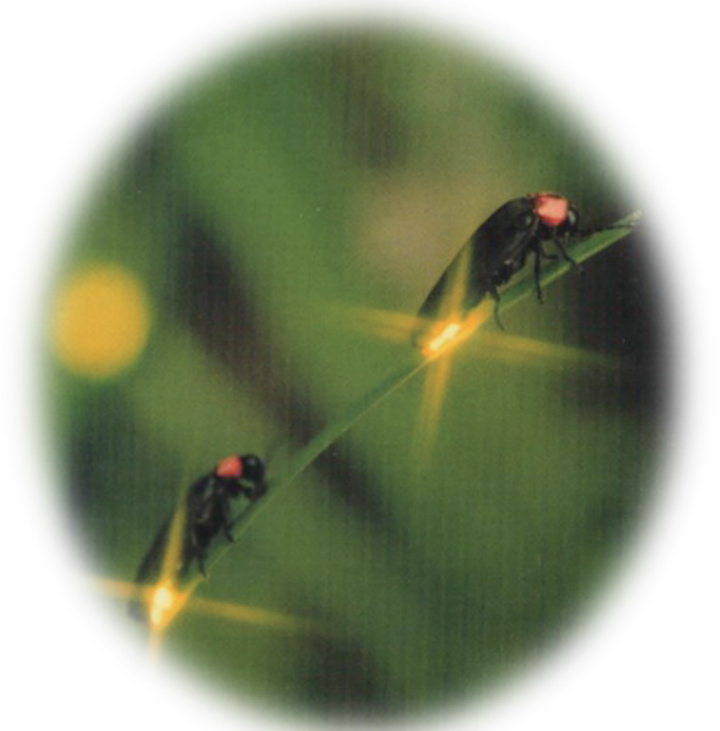
ゲンジホタルの乱舞