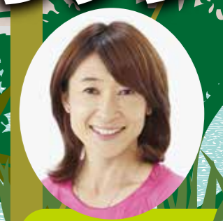
ゲストランナー 谷川 真理