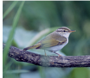
町の鳥 / ういす