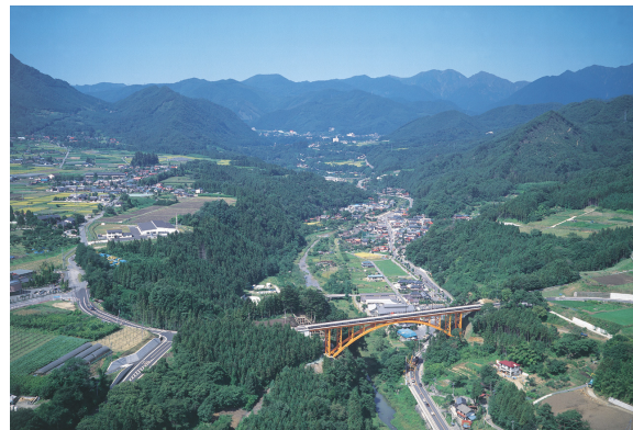
■新治地域上空から