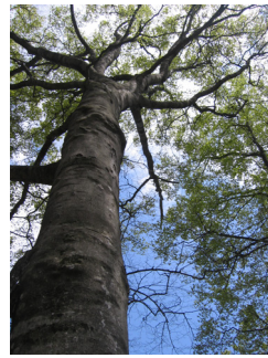
町の木 / プナ