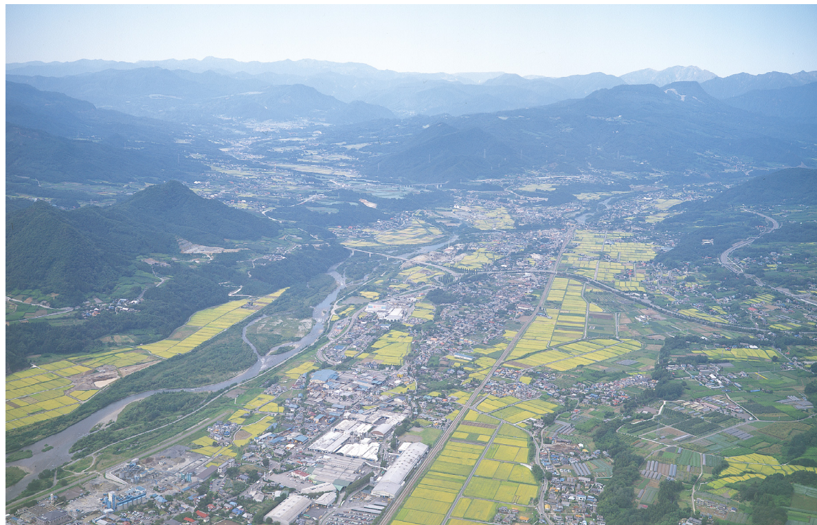
■月夜野地域上空から