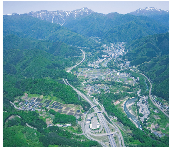
■水上地域上空から

わたしたちは利根川源流の森・山・川を守ります。そして、美しい自然の中でうおいを感じ感性豊かに生活できるまちを創造します。