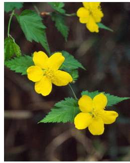
町の花 / やまぶき