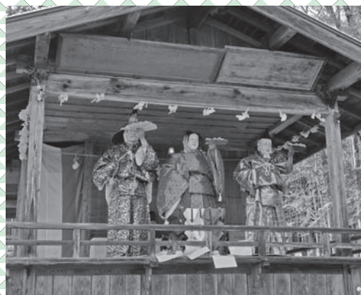
▲4月21日に開催された小川神社の小川太々神楽

公益財団法人群馬県市町村振興協会では、市町村振興宝くじの交付金による「魅力あるコミュニティ助成事業」を行っております。 この事業は、宝くじの普及広報を行うことと、「コミュニティの健全な発展を図ることを目的に、行政区や自治会などのコミュニティ事業への助成を行っているものです。」