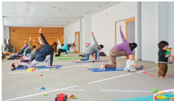
みなかみガールの運動教室でヨガをするママたち