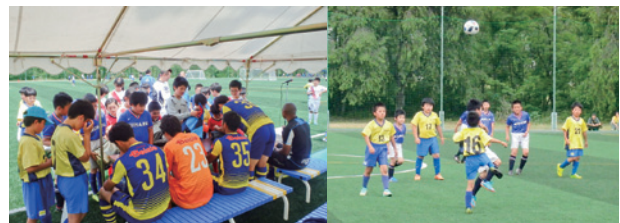
▲ザスパクサツ群馬の選手のサイン会が行われました