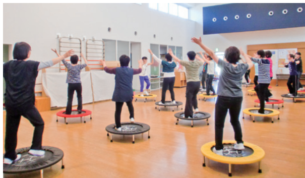
おとなの運動教室でトランポピクスにチャレンジする参加者

体力づくり、少し体を動かしたい人にお勧め。 お子さまづれの参加OKです。 汗をかくのは気持ちいいですよ!