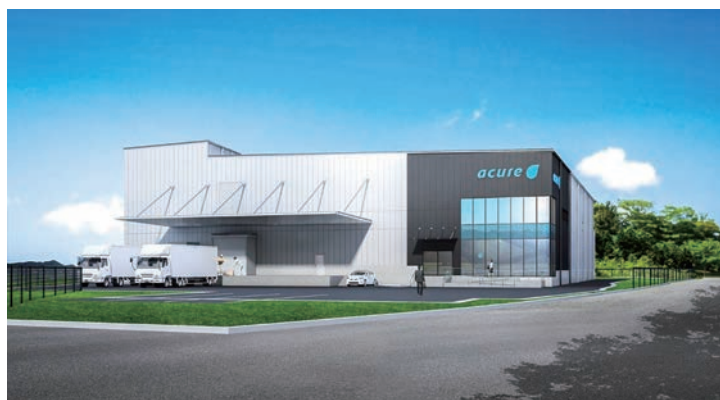
▲みなかみ飲料工場のイメージ図