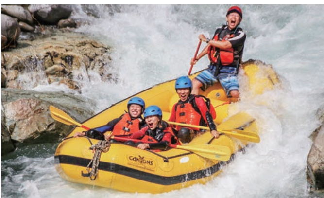
▶友人とラフティングを体験

みなかみって、まだまだ世の多くの人に知られていない秘境のよきな土地で、そこどこ？から、実際に来て、見て、体験して、初めて感じる魅力があるんだと思います。その魅力をほんの少し僕のお話からお伝えすることで、この町に興味を持ってくれるきっかけになればいいかなと感じる、今日この頃です。