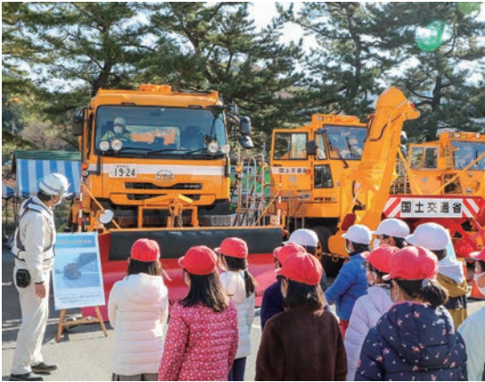
▲式典前に行われた見学会の様子

11月13日、道の駅水紀行館において、国土交通省高崎河川国道事務所主催による除雪出陣式が行われました。式典には、沼田警察署や群馬県建設業協会のほか、水上小学校の代表児童2名が来賓として参列しました。式典の後半には、代表児童2名による作業の安全宣言や除雪車両の出陣命令が行われました。 また、式典前には会場に並べられた除雪車両の見学会が開催され、参加した水上小学校の児童らは車両への搭乗や操作を体験したり、作業員からの説明に聞き入っていました。