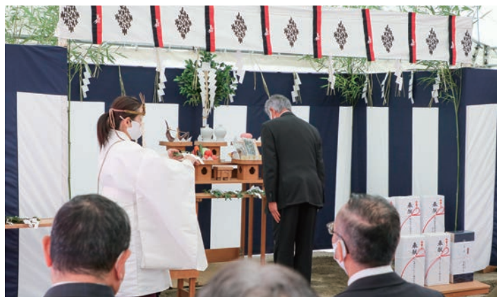
▲町関係者を代表し玉串奉奠を行う鬼頭町長