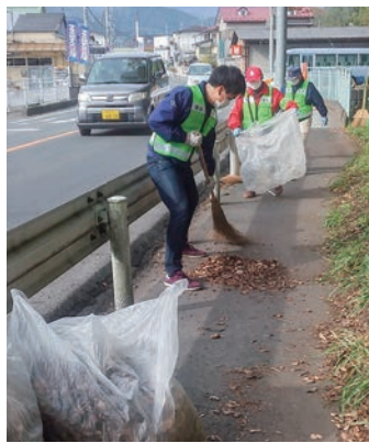
▲歩道の清掃活動を実施