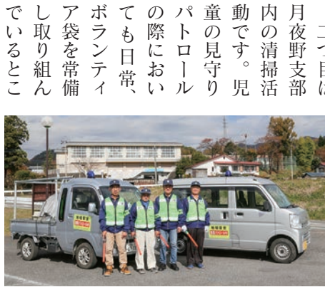
▲青色回転灯を装備した自動車(青パト)

ろですが、ペットボトルやジュースの空き缶等のポイ捨ては後を絶ちません。町内美化のためにも慎んでいただきたいものです。