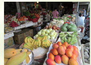
市場では旬のフルーツ