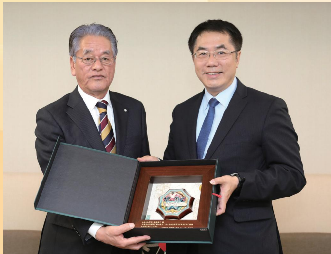
みなかみ町鬼頭町長と台南市黄偉哲市長