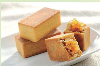
パイナップルケーキ