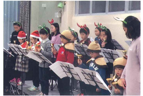
ムジカ・アツレーグラ