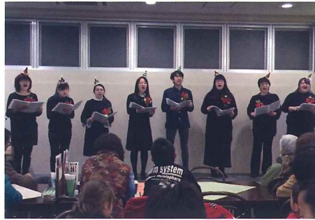
コーラス・ユメカナエ