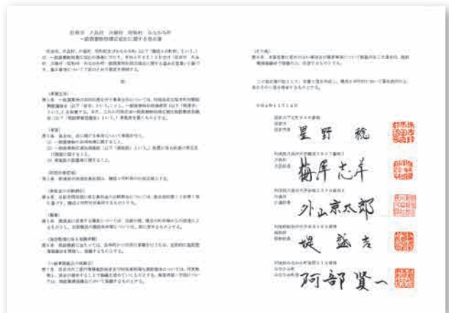
▲一般廃棄物処理広域化に関する協定書