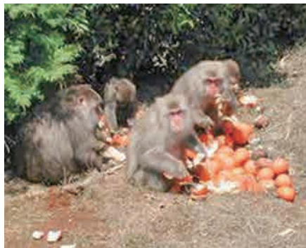
▲残渣を食べるニホンサル

「環境整備」、「侵入防止」、「捕獲」の3つの対策をバランスよく、「地域全体」で取り組むことが大切です。農作業が忙しいとつい、残渣処理を後回しにしているませんか？その「後回し」がサルにとっては美味しい「餌付け」になっているかもしれません…残渣は人間には「不要なもの」でも、サルにとっては「魅力的なエサ」です。