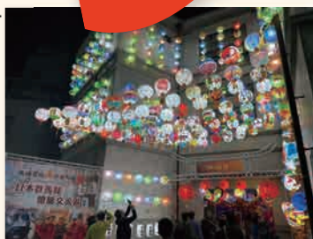
台南市政府消防局 ランタン祭り