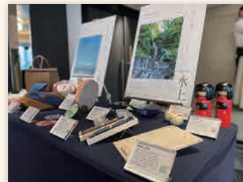
みなかみ町の商品をショールーミング展示（台北）

※ショールーミングとは：商品を購入する前に消費者が店舗等に足を運び、価格や性能などを確かめたうえで、オンラインで商品を購入する仕組み。