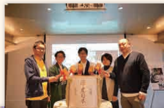
オープニングセレモニーの鏡開き（台北）