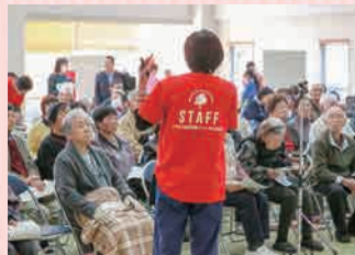
▲介護の講演の様子

■内容 イベントは、介護の講演、飲食ブース、健康ブース、体験ブース等を設け、様々な方が楽しめるように参加団体と企画しております。認知症の理解や地域の方とのコミュニティーの場を提供できるように努めて参りますので、皆様のご来場をお待ちしております。