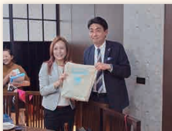
左）台南市政府観光旅游局長 郭さん みなかみの記念品を贈呈