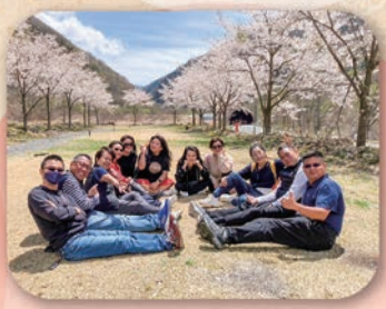
天気にも恵まれ桜の中で撮影。日本の桜にとても喜んでいました！