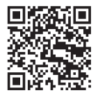
▲国税庁(税務職員採用試験)