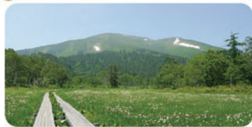
*対象範囲：群馬県利根沼田地域（沼田市、片品村、川場村、昭和村、みなかみ町）

利根沼田行政県税事務所では、利根沼田地域を訪れた方や地域住民の皆さまから、もう一度行ってみたいと思うお店や観光スポットなどを募集するキャンペーンを実施します。応募者の中から抽選で25名に地域の商品券を贈呈します。