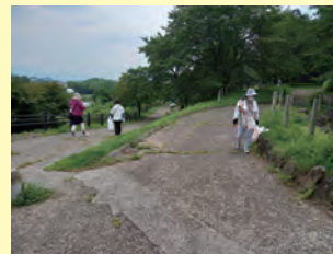
環境美化ハイキング

女性が生涯学習や社会奉仕など様々な活動を行うことを目的とした団体。現在、49 人が在籍し、藤原湖マラソン大会でのボランティアのほか教養講座、レクリエーション大会への参加など様々な活動を行っています。