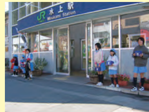
水上駅 ユニセフ募金

利根沼田では唯一のガールスカウトです。令和 7 年 4 月現在で 11 人の少女会員が所属しています。清掃活動や募金、群馬マラソンや各種大会係員など様々なボランティア活動のほかキャンプなどのレクリエーションも多数行っています。