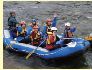
親子ラフティング教室

町内の地域子ども会の集いで、令和 7 年 4 月現在で 25 地区の子ども会が加盟し、幼児から中学生まで 621 人の子どもたちが所属しています。夏休みの親子ラフティング教室や冬の上毛かるた大会などを行っています。