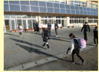
水上小・朝のあいさつ運動