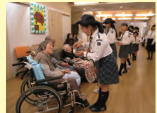
老人ホーム慰問活動