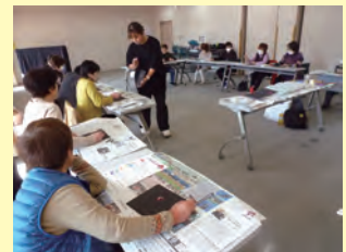
教養講座(チョコレートづくり)