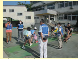
古馬牧小・朝のあいさつ運動

青少年の健全育成活動や非行防止活動を行う組織です。地区や学校と連携し、地域全体で青少年を支える役割を担います。現在 35 人が在籍し、小学校で朝のあいさつ運動を行っているほか、様々な青少年関係の研修や会議に参加しています。