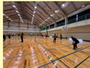
バドミントン大会

町民の体力向上と交流を図ることを目的として、令和 7 年 4 月現在、スポーツ協会は 20 競技、スポーツ少年団は 20 単位団で構成されています。スポーツ協会では、それぞれの競技で年間 70 以上のスポーツ大会を開催しています。