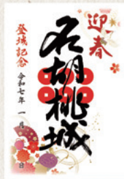
2025年の正月デザイン