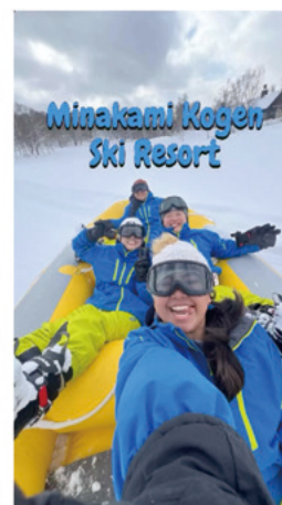
とても素敵なInstagramを投稿してくれています。是非チェックしてみてください!