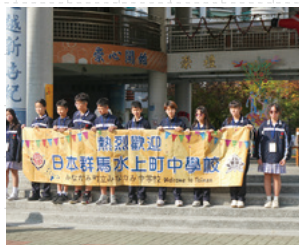
▲崇明中学校出迎え