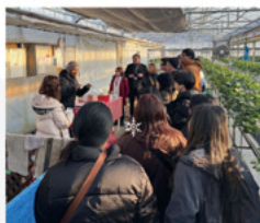
いちご狩り体験の様子