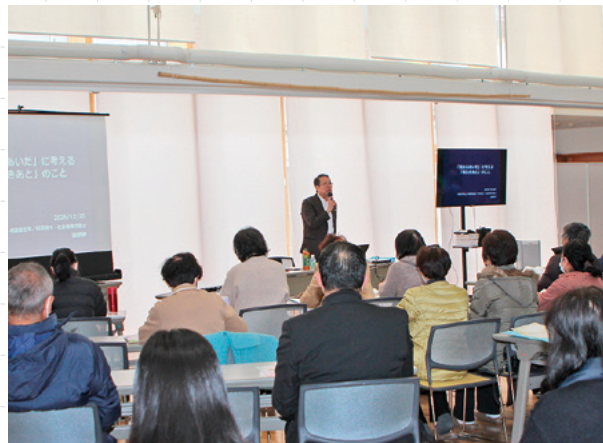
▲障がい児者家族や支援者など40名以上が参加

講師の「いざとなったらどうにかかります。でも孤立だけは避けるように！」の言葉に、孤立しない・孤立させない地域づくりの重要性を参加者一同再確認しました。