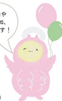
イメージキャラクター きくりん