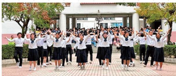
▲崇明中学校でみなComing体操