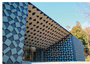
▲史跡金山城跡ガイダンス施設