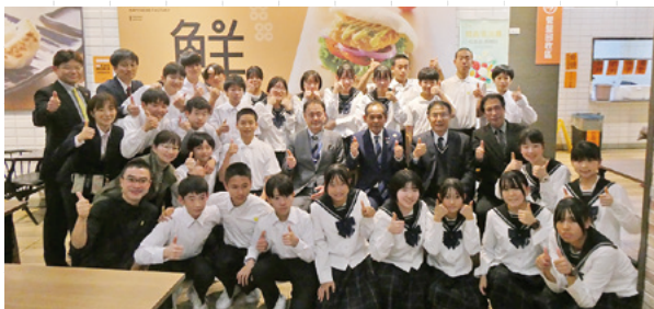
▲台南市長と記念撮影