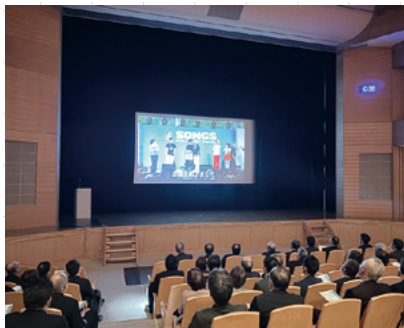
▲20周年記念セレモニー映像上映