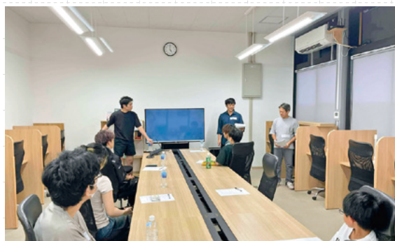
▲ITコンサルタントの講師の話を熱心に聞く学生