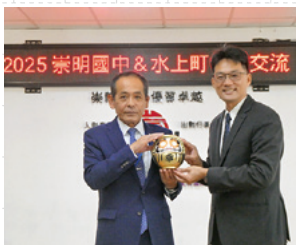
▲崇明中学校長と阿部町長

その後は、カルメ焼きや扇子作りなど、崇明中学校の生徒と台湾の伝統文化に触れる体験学習を行ったほか、みなかみ中学校生徒からは校歌を披露するなど、生徒同士の親睦を深めました。