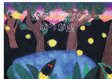
森田未来 (ジーン) (みなかみ中学校2年)