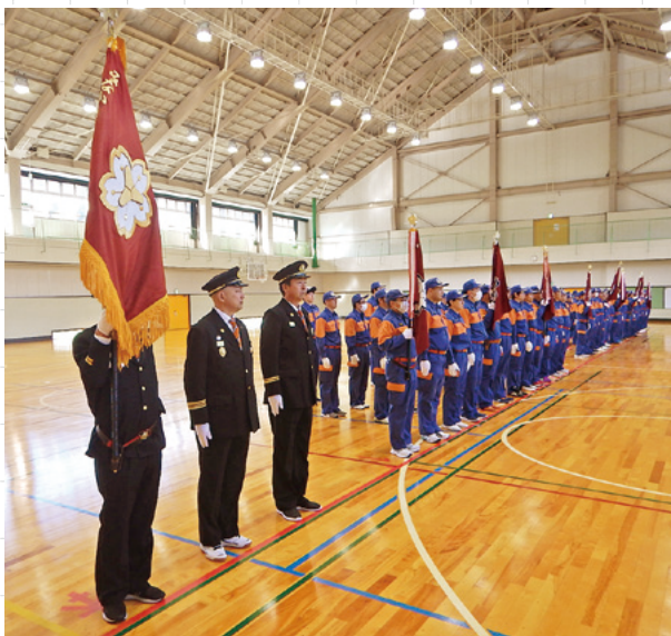
▲整列した消防団員

月夜野総合体育館において、みなかみ町消防出初め式が挙行され約150人が参加しました。出初め式は、一年間の無火災、無災害を祈念するとともに、消防団員が一致団結し、心新たに消防活動を行えるよう毎年開催しています。