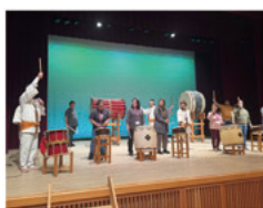
三国太鼓のワークショップの様子