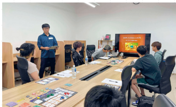
▲大学生生活体験イベントの様子

私の主な活動である後閑駅ナカ学習室の運営では、利用する学生たちの声をもとに改善を重ねてきました。昨年の夏には、町内在住のITコンサルタントの方を講師に招いたイベントや、学習室の卒業生による大学生生活体験イベントも開催しました。参加した学生同士の交流も生まれ、とても有意義な時間となりました。今後も地域の一員として学び続けながら、少しずつ恩返しにつながる活動を続けていきたいと考えています。