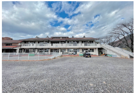
▲月夜野学童クラブ外観