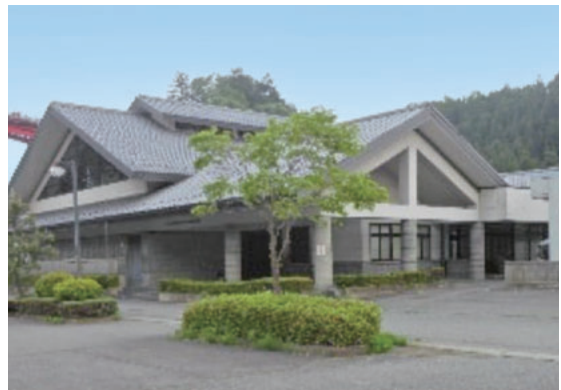
▲おもちゃ美術館に改修予定の 新治農村環境改善センター