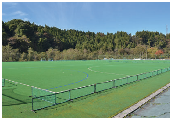
▲改修予定の月夜野ホッケー場