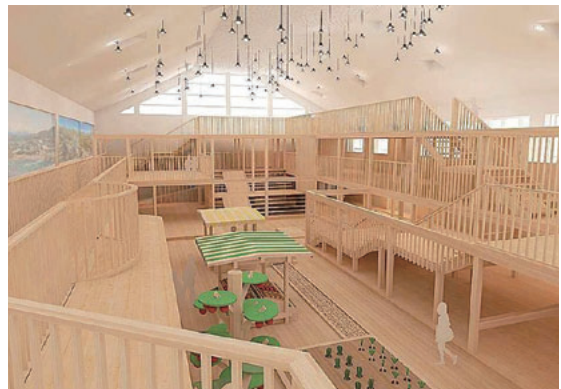
▲おもちゃ美術館イメージ